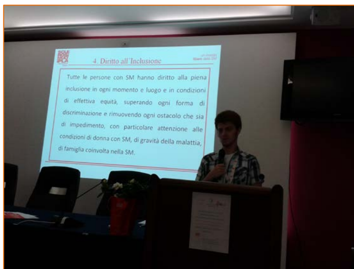
Figura 20. Conferenza presso il Presidio Ospedaliero San Francesco di Nuoro