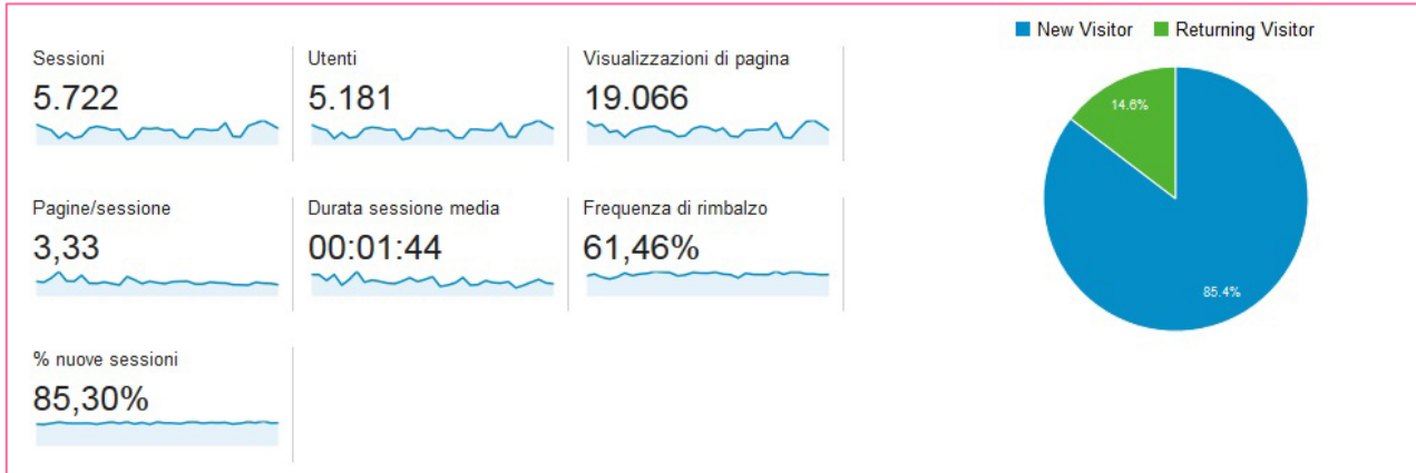
Figura 1. Risulta che 5.181 persone hanno visitato questo sito