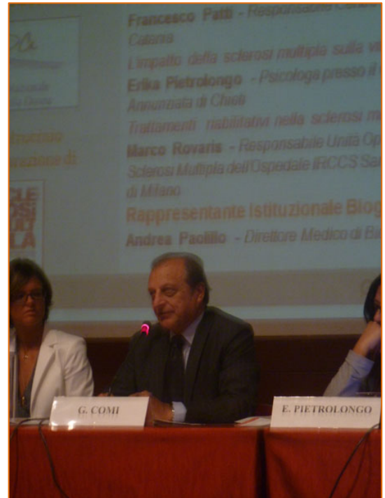
Figura 4. Intervento del Prof. Giancarlo Comi