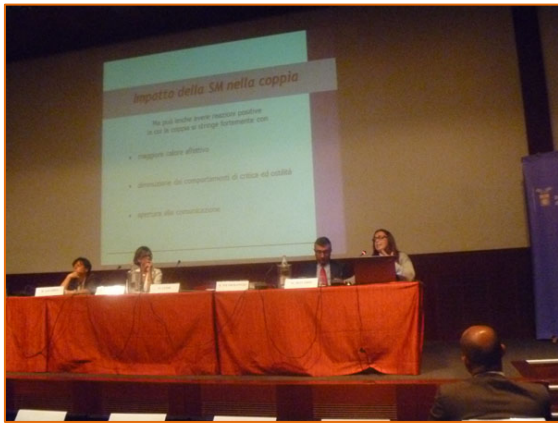
Figura 8. Il tavolo dei relatori