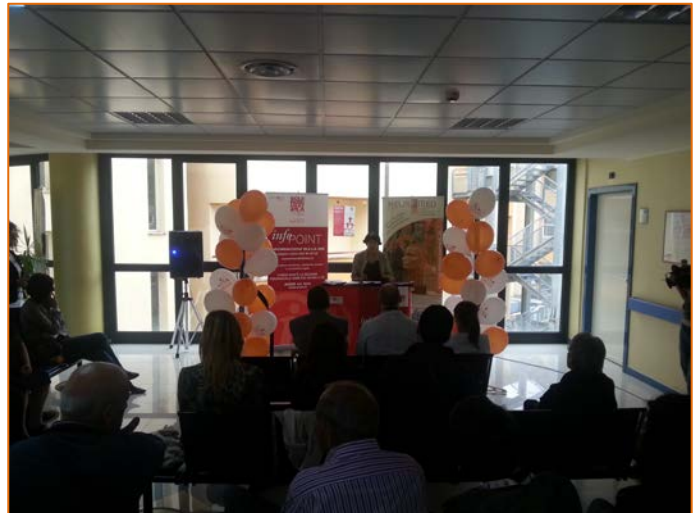
Figura 14. Immagini dal nuovo info point dedicato alla Sclerosi Multipla al Neuromed IRCCS di Pozzilli (IS)