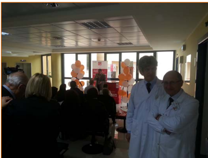
Figura 15. Immagini dal nuovo info point dedicato alla Sclerosi Multipla al Neuromed IRCCS di Pozzilli (IS)