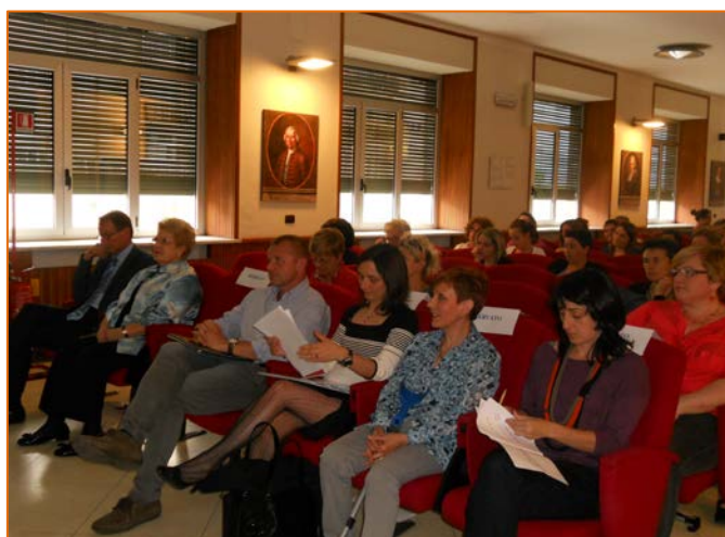
Figura 17. Relatori convegno dell'Azienda Ospedaliera Santa Corce e Carle di Cuneo