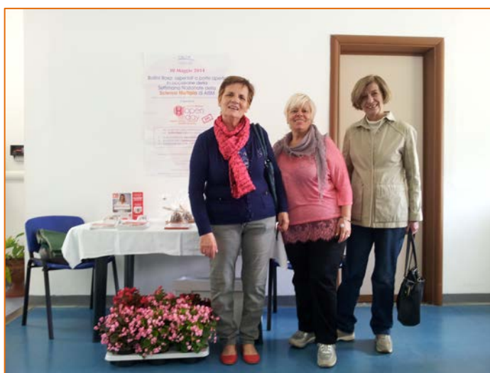
Figura 18. Immagini dall'Ospedale San Martino di Osrignano