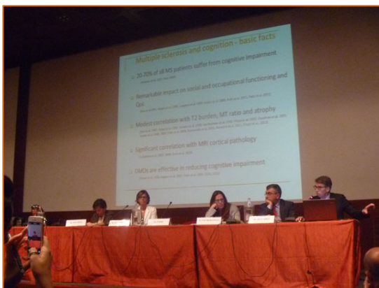
Figura 5. Il tavolo dei relatori