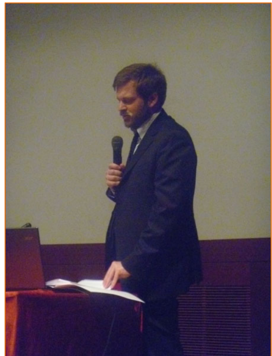
Figura 12. Intervento dell'Assessore Majorino