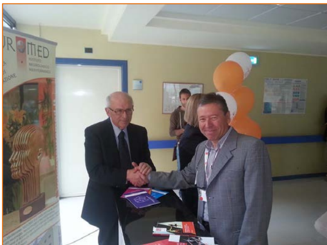
Figura 16. Immagini dal nuovo info point dedicato alla Sclerosi Multipla al Neuromed IRCCS di Pozzilli (IS)