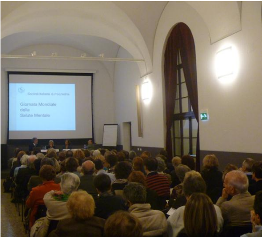
La sala Ricci della Fondazione Culturale San Fedele