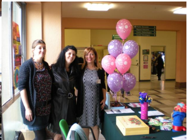
Azienda Ospedaliera Ospedale Maggiore di Crema