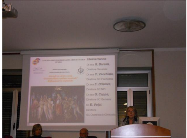
Azienda Ospedaliera Santa Croce e Carle di Cuneo- "Laboratorio esperienziale di musicoterapia (Foto 1) e Incontro aperto al pubblico (Foto 2)