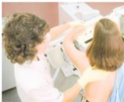
CONTROLLI Salute e donne sotto la lente d'ingrandimento

Il 15 aprile al Polo Ottolenghi verranno illustrati gli esercizi per curare il linfedema. Al CTO, il 15, su prenotazione (02-58296830) visite ortopediche per chi è affetto da alluce valgo. Il 18 sempre al CTO, due ambulatori gratuiti per visite specialistiche alla patologia della mano e alle vene varicose. Su prenotazione allo 02-58296830.