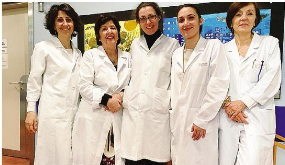
Lo staff del Centro disturbi alimentari di Sondrio