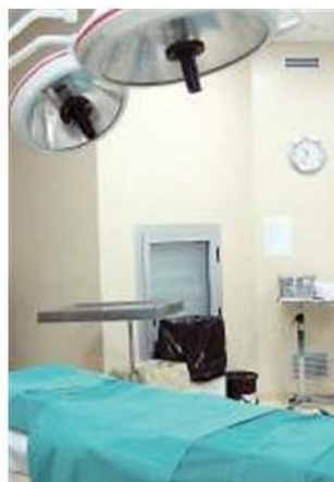
All'ospedale servizi gratuiti

ANCONA Domani si celebra su tutto il territorio nazionale la Giornata nazionale della salute mentale. Anche quest'anno l'Azienda Ospedaliero Universitaria Ospedali Riuniti ha aderito all'invito di O.N.da. Osservatorio Nazionale sulla Salute della donna e di genere per offrire servizi gratuiti clinico-diagno-