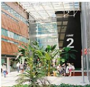
L'ospedale Papa Giovanni

Le iniziative in occasione del 40° anniversario della Legge 180 (Basaglia) e del Mese della salute mentale non finiscono qui. «Tracce di Salute mentale» è il titolo di un dibattito aperto che si terrà sabato 20 ottobre, dalle 14, all'Onp Bistrò di via Borgo Palazzo 130.