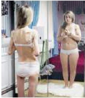
Si parla di disturbi alimentari

ga Ceglie -. Si tratta di una patologia che colpisce molto di più la popolazione femminile, e che si manifesta in età sempre più precoce. È importante l'attività di prevenzione e sensibilizzazione sulle principali patologie legate alla mente, per avvicinare a strumenti e servizi di cura presenti sul territorio».